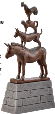
48287 Bremer Stadtmusikanten Statue Fertigmodell The Bremen Town Musicians statue – Finished model L 2,3 x B 0,9 x H 4,4 cm

Das Original dieser von Gerhard Marcks erschaffenen Bronzestatue steht neben dem Bremer Rathaus. Sie ist das Bremer Wahrzeichen und Teil des Stadtwappens.