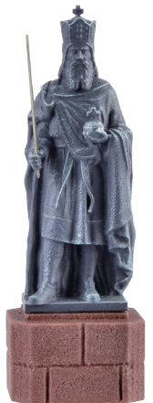
48288 Karl der Große Statue – Fertigmodell Charlemagne statue – Finished model L 1,3 x B 1,5 x H 4,3 cm

Eines der berühmtesten Abbilder des großen Herrschers mit seinen Insignien, dem Reichsapfel und dem Schwert, erschaffen von dem Bildhauer Johann Nepomuk Zwerger im Jahr 1843.